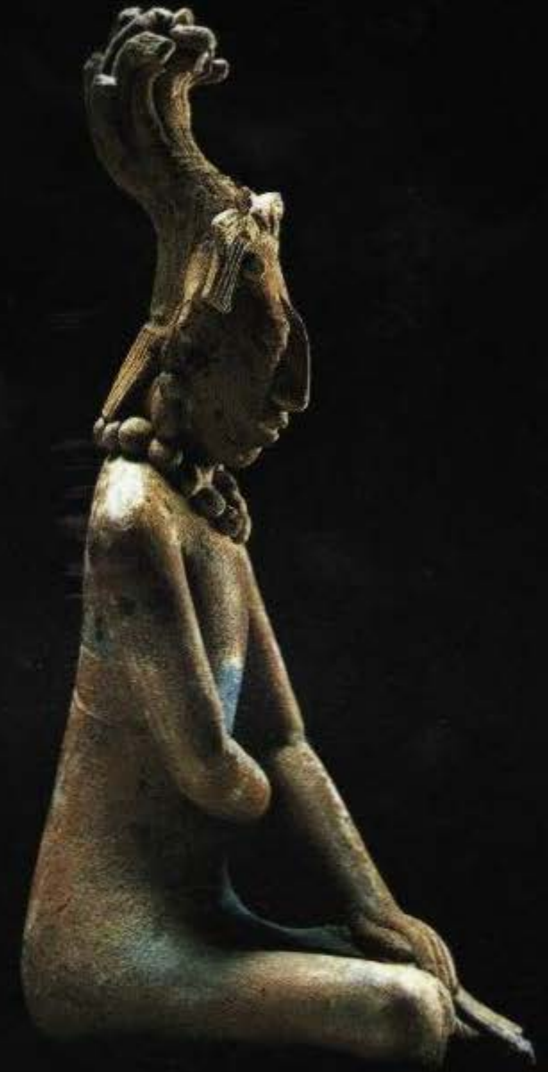
"HOMBRE SEDENTE", TUMBA I GRUPO B.

14 - 19 Junio, 2002 Palenque, Chiapas México