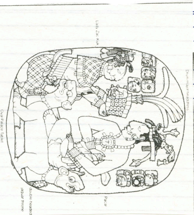
Figure II.5 Oval Palace Tablet Palenque, Chiapas, Mexico Late Classic period, ca. A.D. 652

Pacal, who is about to become king of Palenque, sits on a double-headed jaguar throne that is turned toward the viewer so that both heads can be seen. He wears only a cloth skirt, pectoral, and simple headband. His mother, Lady Zac-Kuk, sits on the floor in front of him. She wears a net overskirt and cape over her hupil and is marked as a ruler by her jester-God headband. She extends a Drum-major headdress, the crown used by Palenque kings, toward her son, giving him the first part of the regalia that will transform him into the king.