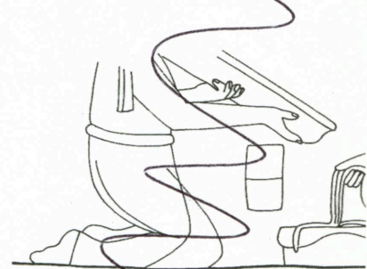
Figura 26. Cuarto 1. Registro 3. Muro primero hincado y el segundo sedente. Dibujo de Alfonso Arellano Hernández.

Jambas. También se hallan es posible observar fragmentos que portan penachos. El de la ja